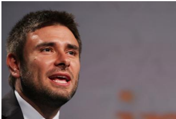
Alessandro Di Battista